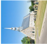
ÉGLISE DE L'ACADIE