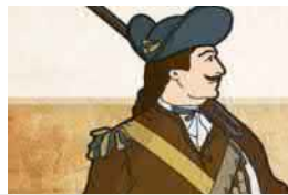
La vie militaire du Fort Saint-Jean